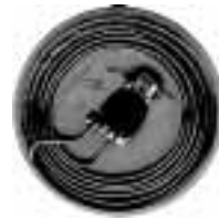
БИЖ-002 Внутреннее устройство